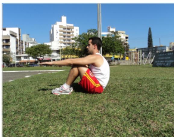
Foto 15: Posição Inicial e Final ( Posição “Um”) - Visão Lateral Foto 16: Posição “Dois” - Visão Lateral